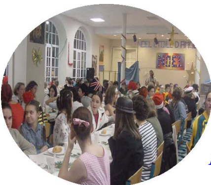
La fête de Noël

mots-clés qui permettent de concrétiser une vie en collectivité basée sur la confiance et le respect mutuel.