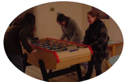
Le foyer élèves