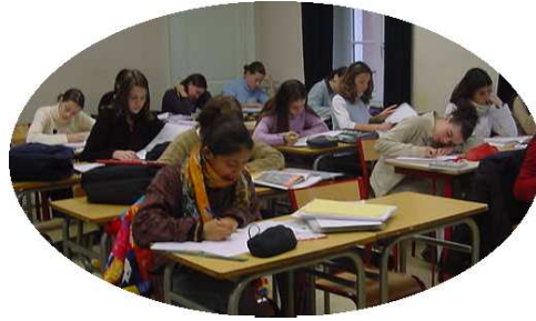
L'étude du soir